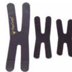
FAIXAS EM X

Faixas de rotação e alinhamento biomecânico. Favorecem a contração muscular e o alinhamento articular. Oferecem informação sensorial e proprioceptiva.