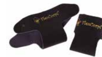
LUVAS DE PREENSÃO

Favorece a preensão em barras (andadores).