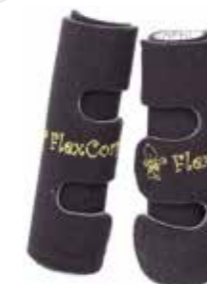
EXTENSOR FLEXÍVEL DE COTOVELOS

Favorece a preensão em barras (andadores).