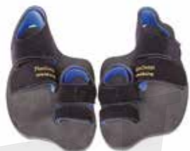
PAR DE SANDÁLIAS DUPLAS