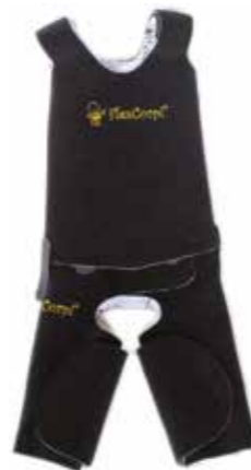
COLETE E BERMUDA

Colete e bermuda para retificação e manutenção da postura.