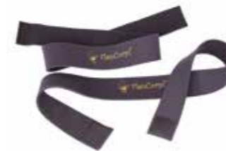
FAIXAS DE MMII, MMSS E ABDOMINAL