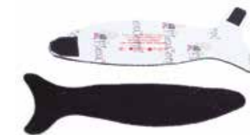
ABDUTOR DE POLEGAR

Abdução do polegar e estabilização do punho .